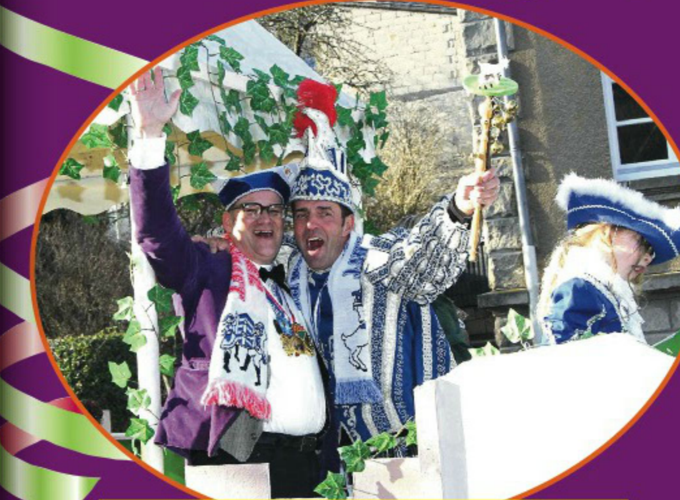
„Einsamer Prinz sucht Prinzessin zum Mitreisen“ – war das etwa der Bachelor von Kempenich ...?