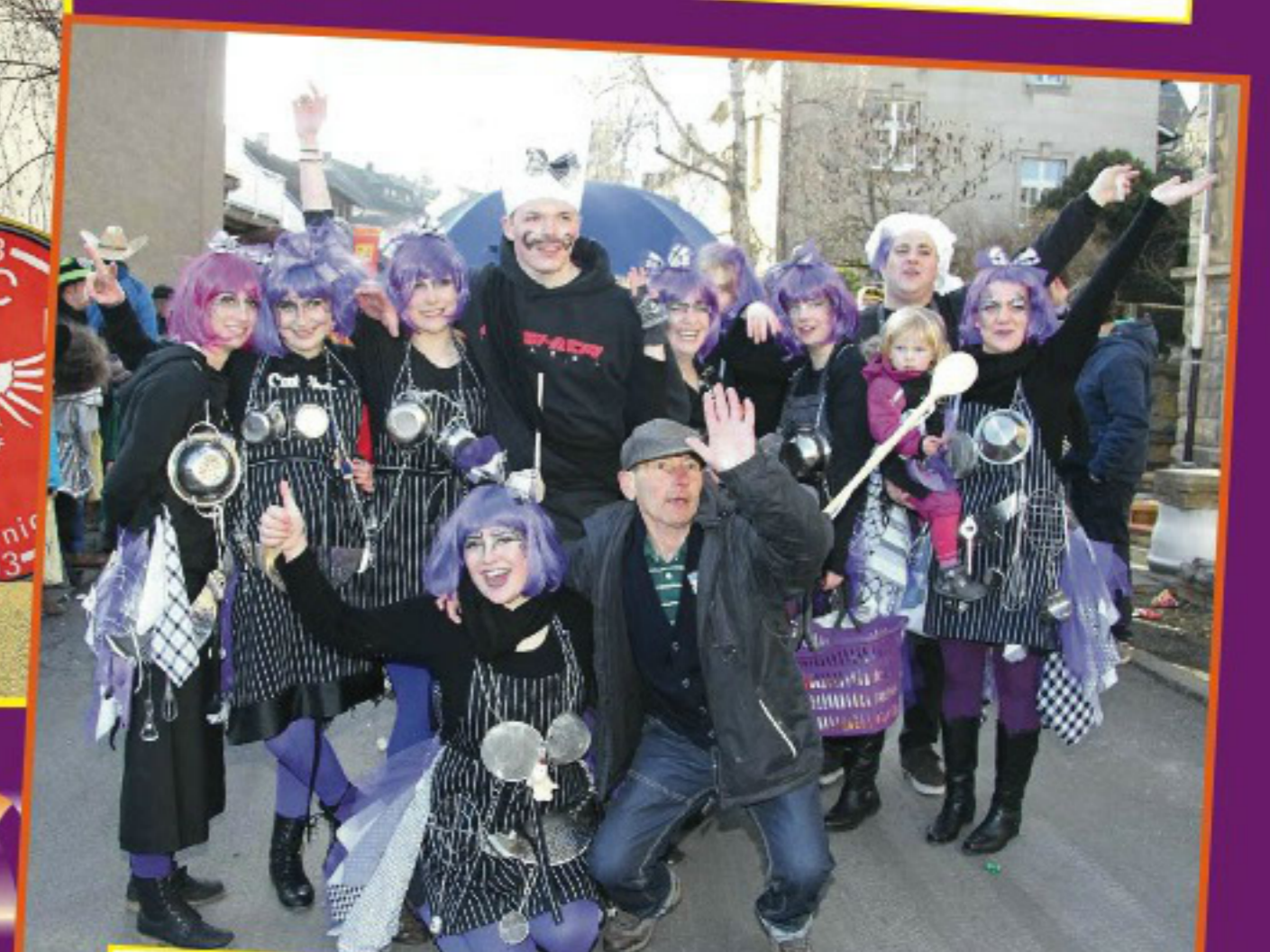
Das Team des Seniorenhauses Marienburg brachte als Küchen-Feen gute Laune unter die Jecken.