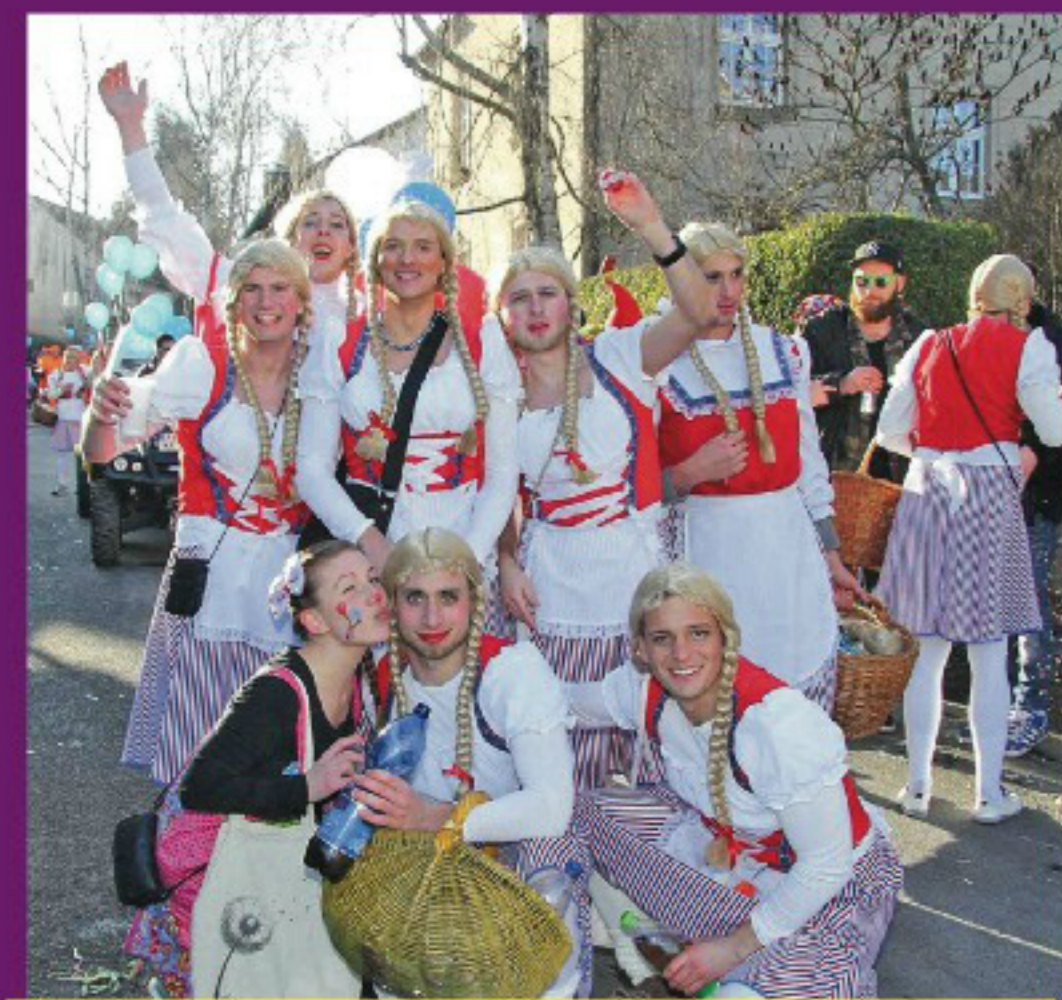
„Frau Antje“ aus Holland – die 1. Mannschaft des SC aus Kempenich mischte sich mit Holländer Käse unters Volk.