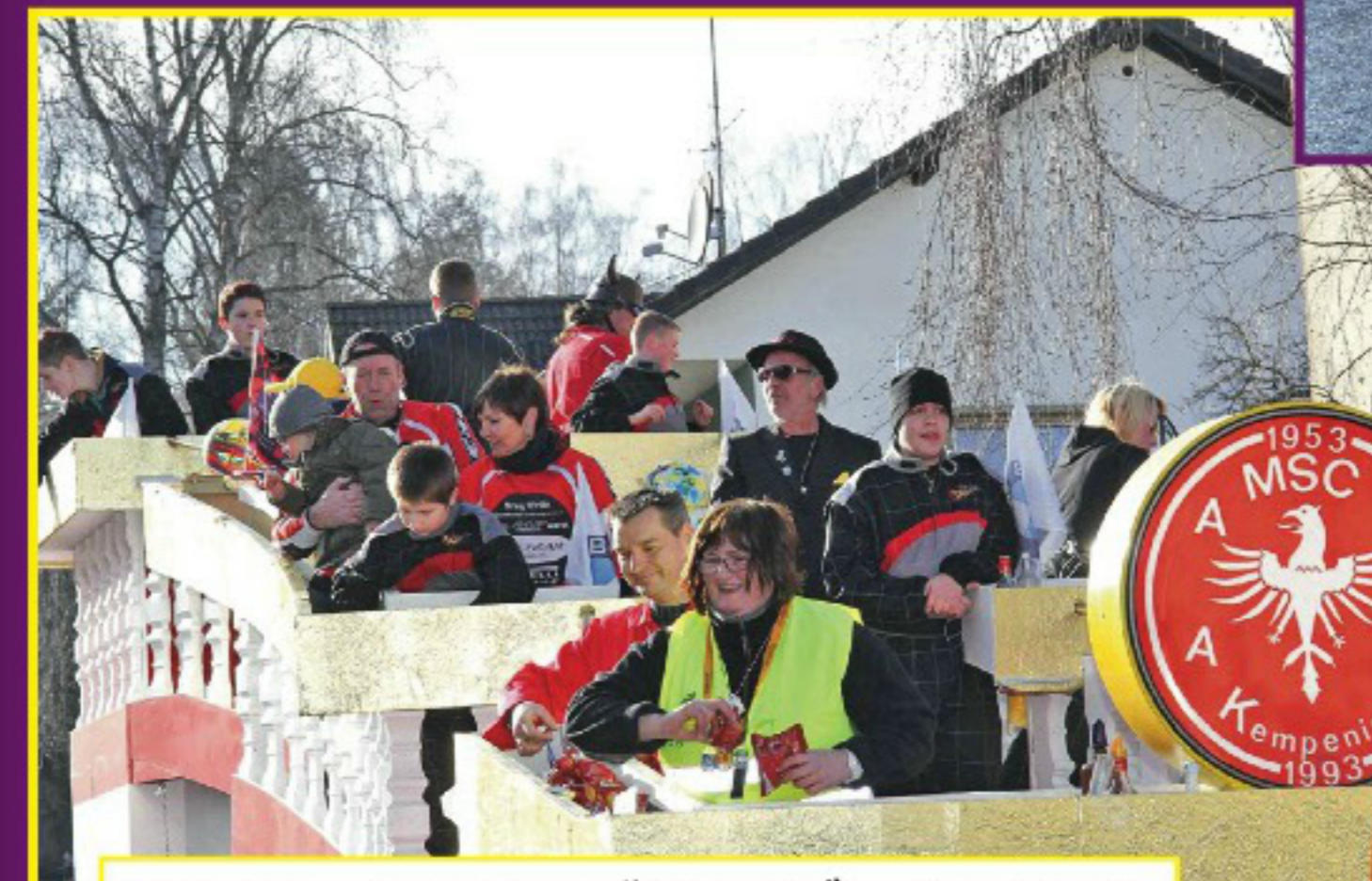
ADAC und „Rettet den Nürburgring“ hatte der MSC Kempenich als Motto auf seinem Wagen umgesetzt.