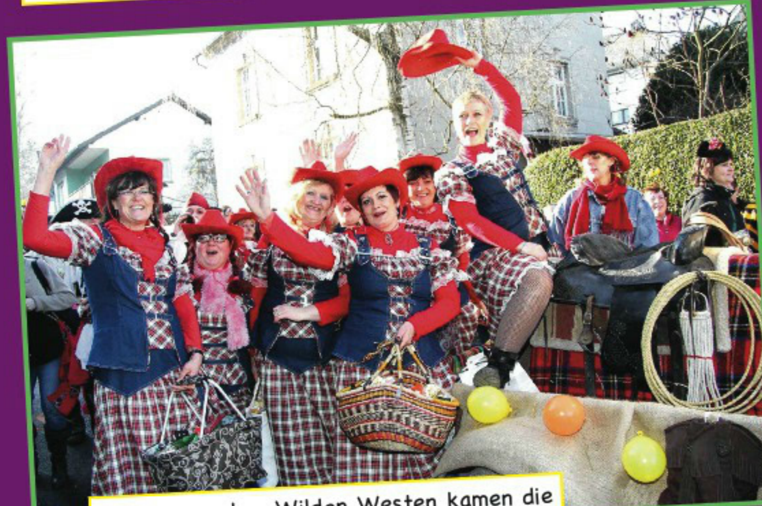
Mitten aus dem Wilden Westen kamen die Möhnen-Cowgirls angeritten.