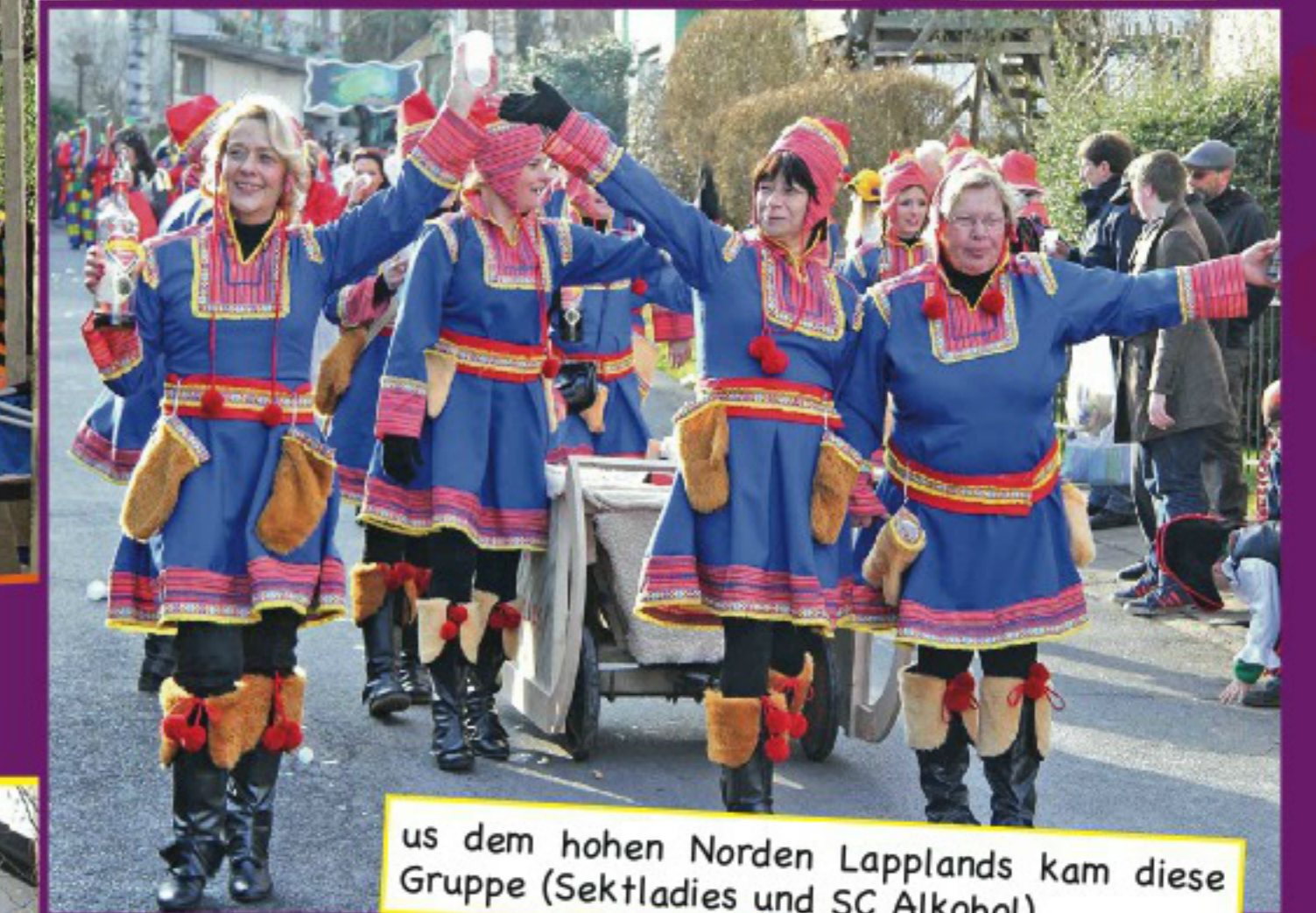
us dem hohen Norden Lapplands kam diese Gruppe (Sektadies und SC Alkohol).