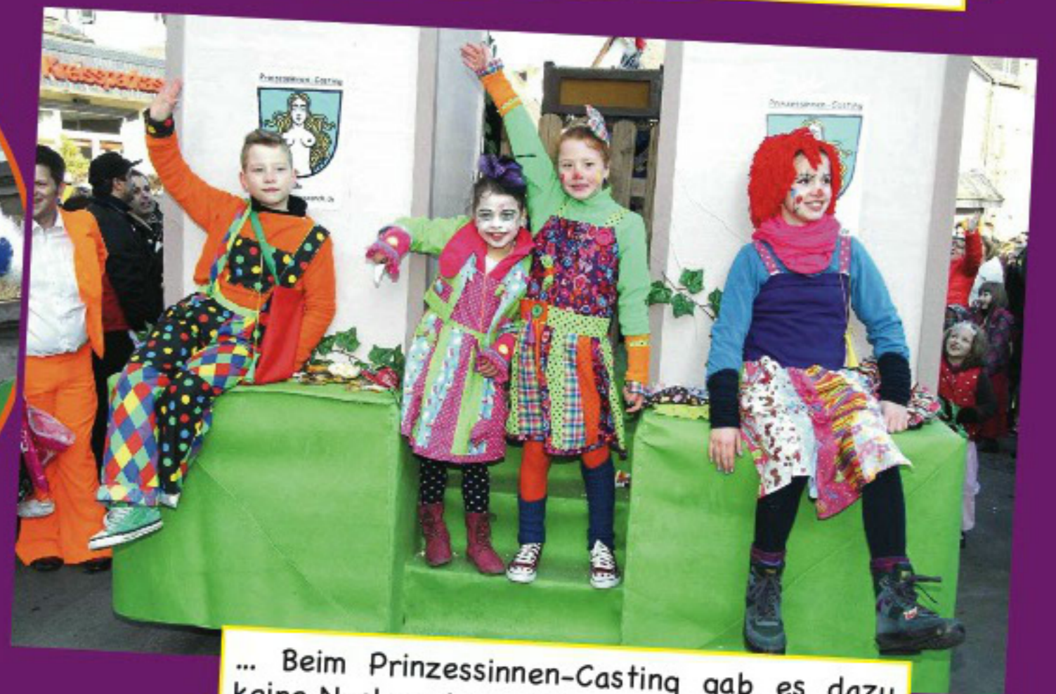
... Beim Prinzessinnen-Casting gab es dazu keine Nachwuchssorgen.