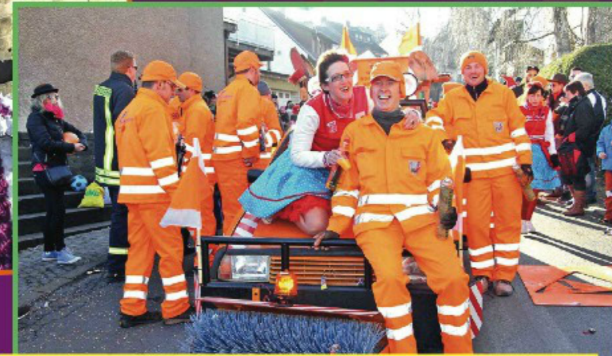
Die Kempenicher Voyeure besserten als Straßenkolonne gleich alle Schlaglöcher auf dem Zugweg aus.